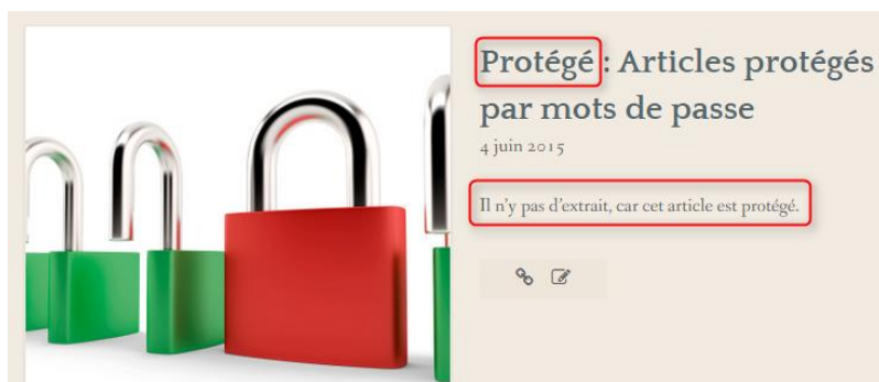
Article protégé : vue en page d'accueil

Les étudiants ont donc la possibilité de protéger un article par un mot de passe. Dans ce cas, seul le titre de l'article sera public et visible sur la page d'accueil ou dans les résultats de recherche, avec la mention « Protégé ». Il faudra que l'étudiant vous communique le mot de passe d'accès pour que vous puissiez en consulter le contenu (nous recommanderons aux étudiants d'utiliser toujours le même mot de passe pour vous faciliter la tâche).